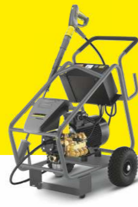
HD 16/15-4 Cage Plus Farmer