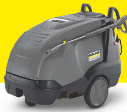
HDS 11/18-4 S Farmer