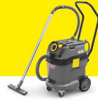
NT 40/1 Ap L Farmer