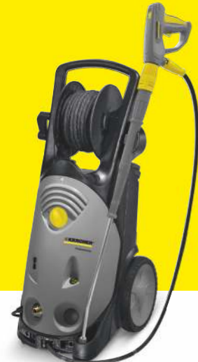
HD 10/21-4 SX Plus Farmer