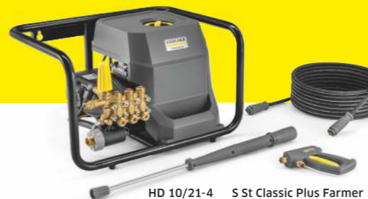
HD 10/21-4 S St Classic Plus Farmer