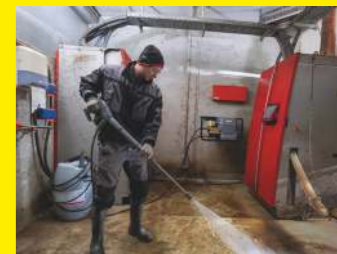
Stationäre Melkstandreiniger HD 10/21 und HD 13/18-4 S St Classic Plus Farmer