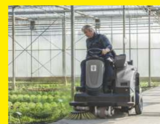
Kehr- u. Kehrmaschinchen