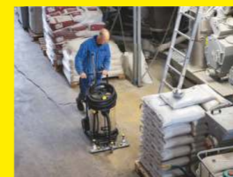
Multifunktions-Flächensauger NT 75/2 Tact² Adv Farmer