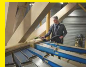
Silo-Sauger IVM 40/24-2 M ACD Adv Farmer